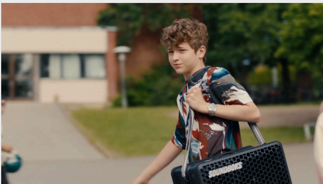
(KADAR SLIKA 2, PROTUKADAR SLIKA 3)